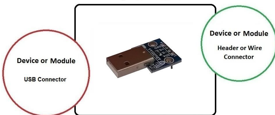
شکل 1: راه اندازی برد تبدیل

برد تبدیل دارای پین هدر 2.54 میلی متر، کانکتور USB - Male - A و دو عدد سوراخ 3 میلی متر نگه دارنده برد می باشد.